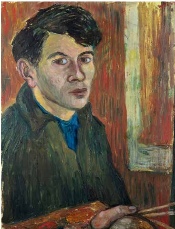
Selbstporträt von Peter Weiss, o.D., Akademie der Künste, Berlin, Kunstsammlung