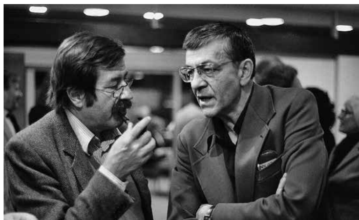
Günter Grass und Peter Weiss in der Akademie der Künste am Hanseatenweg, Foto © Karin Gaa, 1981