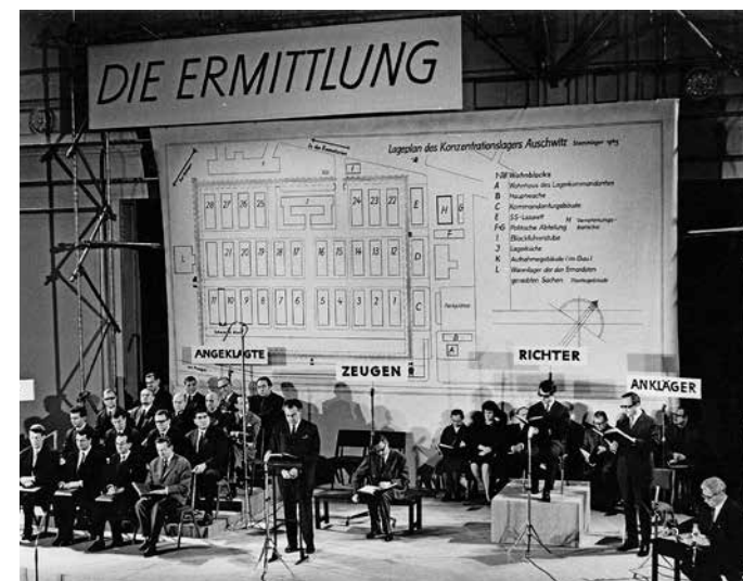
Die Ermittlung. Szenische Lesung am 19.10.1965, veranstaltet von der Deutschen Akademie der Künste in der Volkskammer der DDR

Hanns Zischler liest aus den Werken von / reads from the works of Peter Weiss